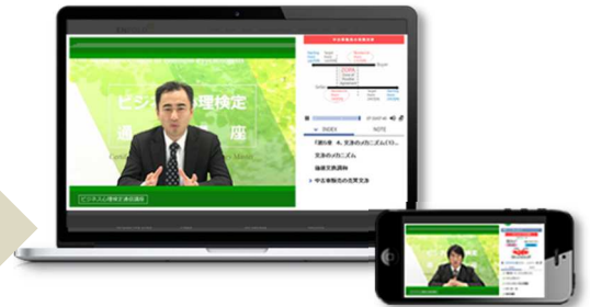
サンプル「ビジネス心理検定オンライン講座」

パワーポイントの講義スライドと講師をご準備ください。 後は当社スタジオにて収録するだけです。当社スタジオと撮影機材は無料でお貸出します。動画配信できるeラーニング用講義動画を5万円～制作できます。