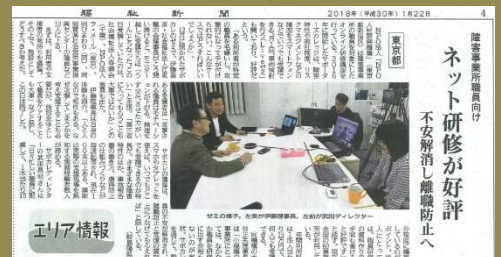
サポーターズ・カレッジLIVEゼミ (当社スタジオよりLive配信中) 福祉新聞(2018/1/22) 第4面「ネット研修が好評」より