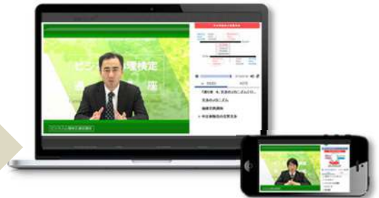
サンプル「ビジネス心理検定オンライン講座」

パワーポイントの講義スライドと講師をご準備ください。 後は当社スタジオにて収録するだけです。当社スタジオと撮影機材は無料でお貸出します。動画配信できるeラーニング用講義動画を5万円～制作できます。