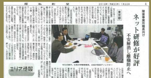
サポーターズ・カレッジLIVEゼミ（当社スタジオよりLive配信中） 福祉新聞(2018/1/22) 第4面「ネット研修が好評」より